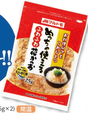
めっちゃ使える ふわふわ花かつお (25g×2) 常温